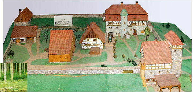
Links: Die 1991 gesicherten Mauerreste des Wohnhauses des Johanniter-Berghofes „Lange Bahn“. Oben: Modell der Anlage. Die Gestaltung des Fachwerks entspringt aber der Fantasie. Rechts: Ausschnitt aus einer alten Karte (Müller, Suhl, 1813): Um den Berghof „Lange Bahn“ befand sich waldfreies Land, unterhalb am Berghang zum Dreisbach: das „Commenturie-Holz“, das zum Berghof gehörte.

Zurück zum Hauptweg auf der Höhe führt der Weg vorbei am Kirchberg, der am „Herrneller“ noch mancherlei rätselhafteste Steinsetzungen verbirgt. Schließlich, nach einer „Spitzkehre“ gelangt man unterhalb des Kirchberges zur Bergbaude und zur Ruine „Lange Bahn“ . Dies ist auch die letzte Station des Wanderweges. Die Ruine geht auf den gleichnamigen Berghof des Johanniterordens zurück, der diesen 1292 von den Henneberger Grafen erwarb. Bis 1823 bewirtschaftete der Orden den Hof und einige Hektar Weideland ringsum – hauptsächlich mit Viehzucht. Nach 1825 wurden der Hof und die Waldungen vom Forstfiskus erworben, die Gebäude zum Abbruch verkauft und bis auf die heute noch erhaltenen Mauerreste abgerissen.