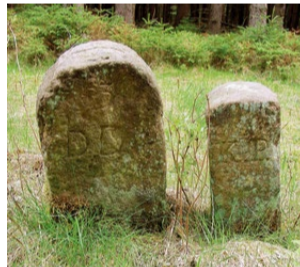
Bild oben: Grenzsteine (Königreich Preußen – Herzogtum Meiningen).