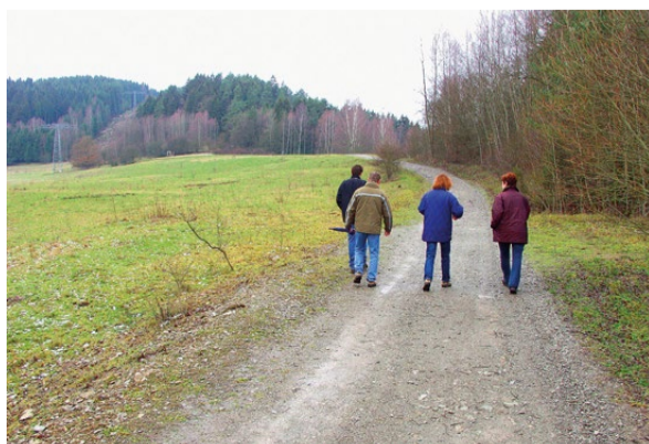
Auf dem Weg zum Ausgangspunkt des archäologischen Wanderweges. Im Hintergrund: der Buchberg.

Bodendenkmale und Bodenfunde sind oft unsere einzigen Verbindungsglieder in die Vergangenheit, aus der uns keine schriftlichen Quellen mehr erzählen können. Deshalb sind Bodendenkmale zu schützen, damit sie auch unserer Nachwelt erhalten bleiben. Der archäologische Wanderweg tangiert eine Vielzahl von Bodendenkmälern und geschützten Landschaftsbestandteilen, wie Hohlwege, Hügelgräber, Erd- und Steinwälle, Grenzsteine, Grundmauern und Ruinen ehemaliger Gebäude und andere Siedlungsreste. Manche wird das ungeübte Auge kaum als solche erkennen. Doch dank der Erklärungstafeln und Hinweisschilder werden sie auch dem Laien sichtbar.