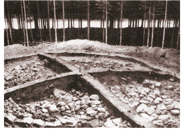
Oben: Während der archäologischen Ausgrabung eines bronzezeitlichen Grabhügels durch das Museum für Ur- und Frühgeschichte Weimar auf dem Schmeheimer Berg Mitte der 1960er Jahre.