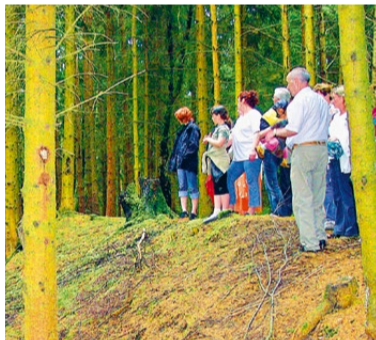
Urgeschichtliche Wallanlage auf der Silbachshöhe. Sie wird wegen der mittelalterlichen Laurentiuskapelle, die in ihrem Innern stand, auch „Lorenze“ genannt. Die Wälle haben z.T. eine beachtliche Höhe.

Die nächste Station bringt uns noch viel weiter in die Vergangenheit: ein bronzezeitliches Hügelgräberfeld , vermutlich in der mittleren Bronzezeit (1600–1200 v. Chr.) angelegt. Diese fünf stattlichen Grabhügel haben Durchmesser bis 15 Meter und sind bis zwei Meter hoch. In der so genannten Hügelgräberbronzezeit wurden die Toten ebenerdig – meist in einem Holzsarg – beigesetzt. Ausgestattet mit gewissen Statussymbolen und persönlicher Habe wurde über der Bestattung ein Hügel aufgeschüttet, der oftmals noch einen Steinkranz als Umrandung erhielt.