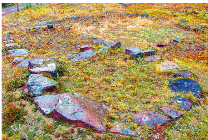
Grundmauern eines Gehöfts in „Leipzigs Rasen“.

Anhand der geborgenen Fundstücke auf der Wüstung „Leipzigs Rasen“ – Gefäßbruchstücke, Ofenkacheln, Flachglasscherben, Dachziegelreste und stark verrostete Eisenteile – ist zu vermuten, dass die Anlage planmäßig verlassen wurde. Eine zeitliche Einordnung vom 13. bis ins 17. Jahrhundert ist dank Vergleichsfunden möglich. Die Namensgebung lässt sich auf Lautverschiebung zurückführen. Aus dem 1357 erstmals genannten „Bloßenlewen“ wurde über „Leubach“, (mda.: „Leubich“) schließlich „Leipzigs“. Und weil Gras über die Sache gewachsen war, kam dann wohl noch der „Rasen“ dazu.