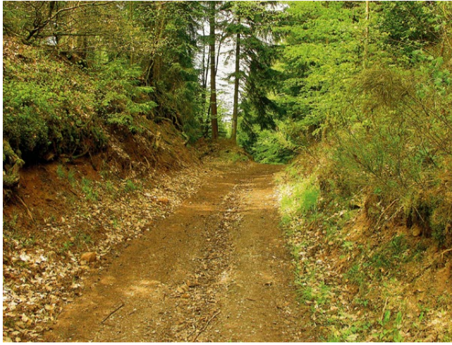
Alter Hohlweg am Aufstieg zum Buchberg.

Da sich alle archäologischen Stätten und Objekte des archäologischen Wanderwegs am ursprünglichen Platze befinden, richtet sich der Verlauf des Weges nach den Positionen der Bodendenkmale. Darum sind Ausgangs- und Endpunkte im Wald und nicht an gut anfahrbaren Orten. Der Verlauf des Weges selbst ergibt leider auch keinen Rundkurs, wie er für Lehrpfade gebräuchlich ist. Unsere Vorfahren haben ihre Spuren eben an den Stellen hinterlassen, wo sie sind, und nicht daran gedacht, dass wir ihnen einen Wanderweg widmen werden.